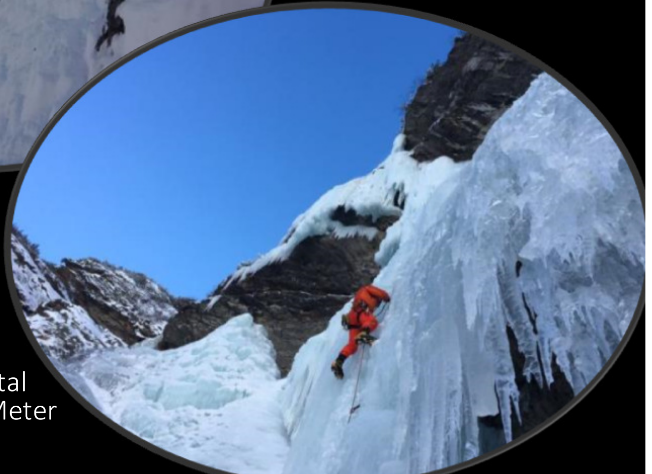
Monsterline Pitztal Wasserfall 300 Meter