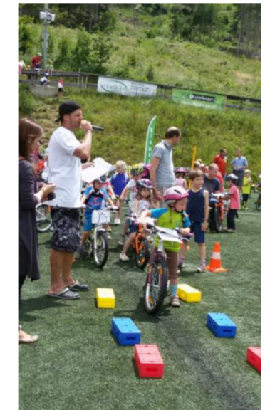
67. Generalversammlung des SV Sistrans 2016