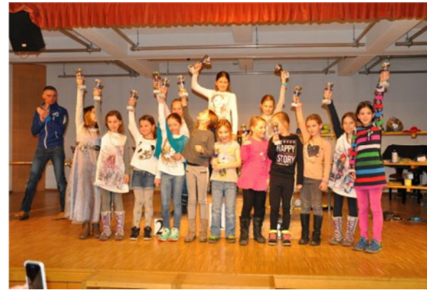
18. November 2016