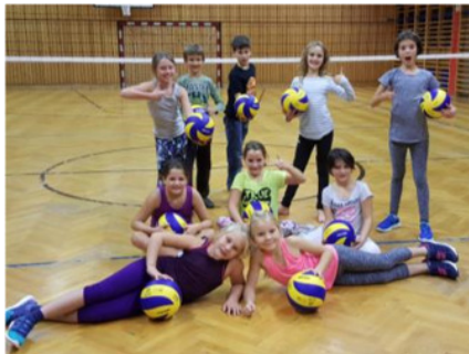
18. November 2016

Herbst/Frühjahr 16/17 20 Kinder (6-12 Jährige) 56 Stunden/1 Trainer