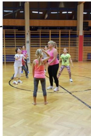
67. Generalversammlung des SV Sistrans 2016