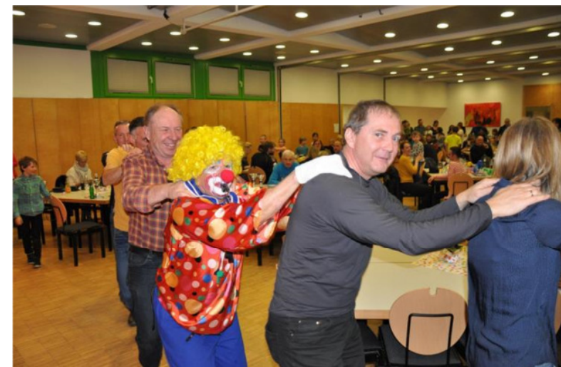
18. November 2016