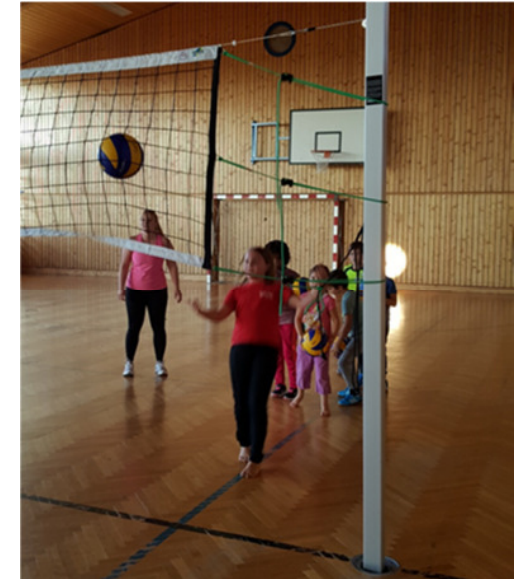
67. Generalversammlung des SV Sistrans 2016

Herbst/Frühjahr 16/17 20 Kinder (6-12 Jährige) 56 Stunden/1 Trainer