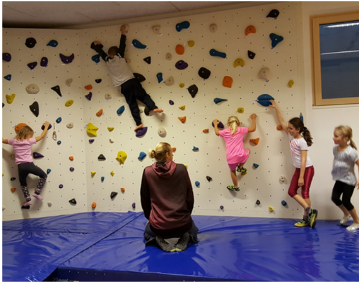
18. November 2016

Herbst 2016: 16 Kinder (5-10 Jährige) 20 Stunden 1 Trainer