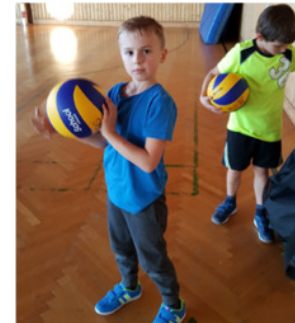
18. November 2016

Frühjahr 2016: 25 Kinder (6-12 Jährige) 24 Stunden/1 Trainer