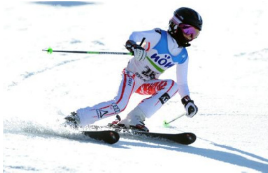
18. November 2016