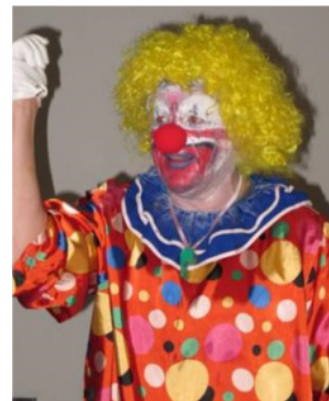
67. Generalversammlung des SV Sistrans 2016