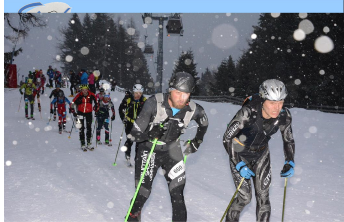
18. November 2016