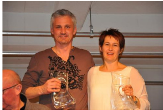
67. Generalversammlung des SV Sistrans 2016