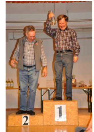
67. Generalversammlung des SV Sistrans 2016